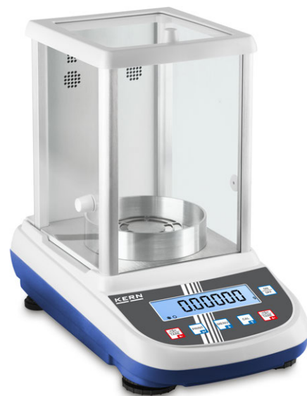
1 KERN ALJ 200-5DA con ionizzatore opzionale 2, vedi Accessori

Serie di bilance analitiche con ampio range di pesata – adesso disponibile anche con certificazione di approvazione [M] o come bilancia analitica semimicro